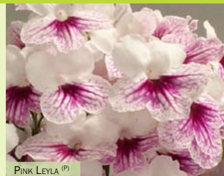
PINK LEYLA (P)