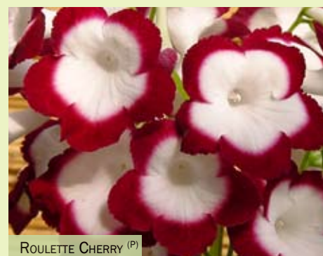
ROULETTE CHERRY (P)