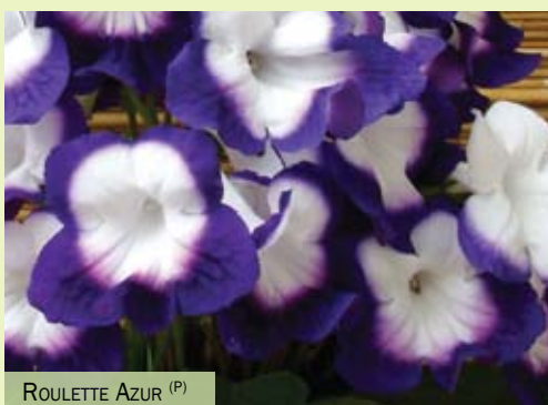
ROULETTE AZUR (P)