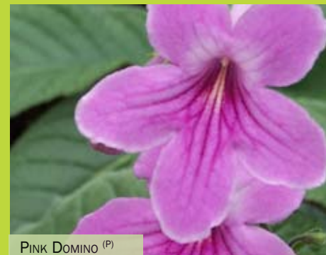
PINK DOMINO (P)